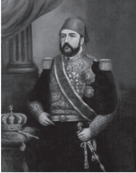
الخدّيو إسماعيل باشا.

مرتب رئيس الوزارة، وقَبِل أن يحال عليهما عمل المراجعة، وأن يكون لهما الإشراف التام على خزانة الدولة. وألجأ رئيس الوزارة «شريف باشا» إلى الاستقالة؛ لأنه كان يصر على تجديد الحياة النيابية، فأشارت عليه إنجلترا باختيار «رياض باشا» للوزارة، وهو سياسي حازم كان يوافق الخديو في أمور ويخالفه في أمور، فقد كان معروفاً بميله إلى الصرامة في معاملة الحزب العسكري والمتطرفين. ولكنه كان من الجانب الآخر معروفاً بميله إلى الحد من سلطة الخديو ولا سيما حق الإنعام بالرتب والأوسمة، فكان الخديو يؤيده حيناً ويخذله حيناً ويتصل من ورائه بالمتطرفين مع أنه لا ينوي أن يجيئهم إلى ما يطلبون. واتسعت أبواب التدخل أمام إنجلترا، ما بين خلاف الأمير ووزيره وخلاف الأمير والوزير معاً وقادة الجيش وطلاب الدستور. وكان «رياض باشا» يطلب إقالة